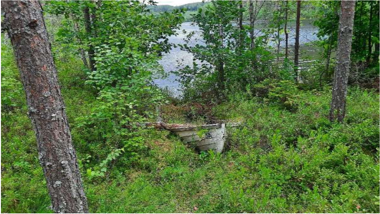
Abbildung 4) Alles ist vergänglich.

Für weitere Bilder steht das Internet oder der obige Link zur Verfügung.