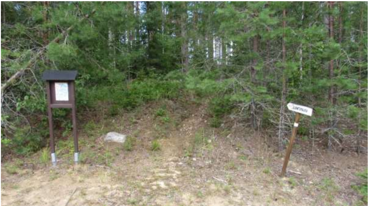
Abbildung 3) Beginn und Ende am Parkplatz.