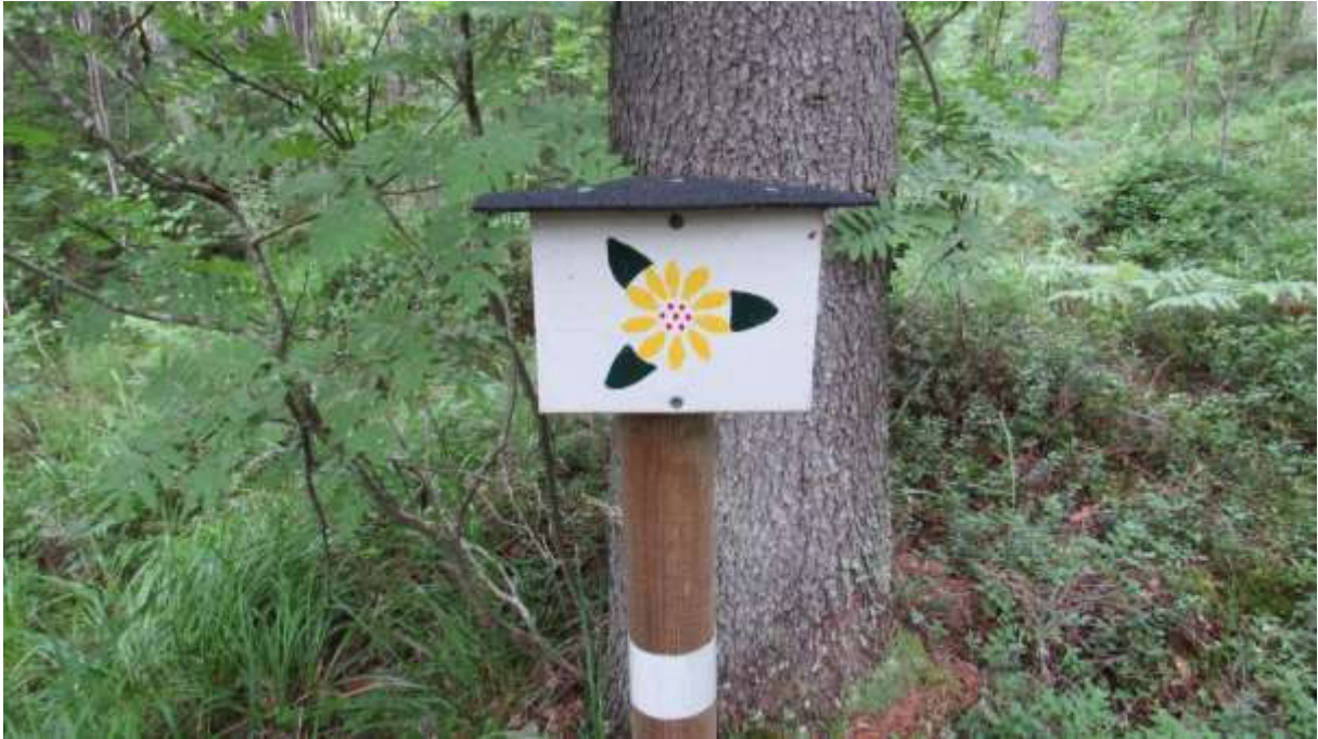
Abbildung 2) Symbol des Wanderweges.