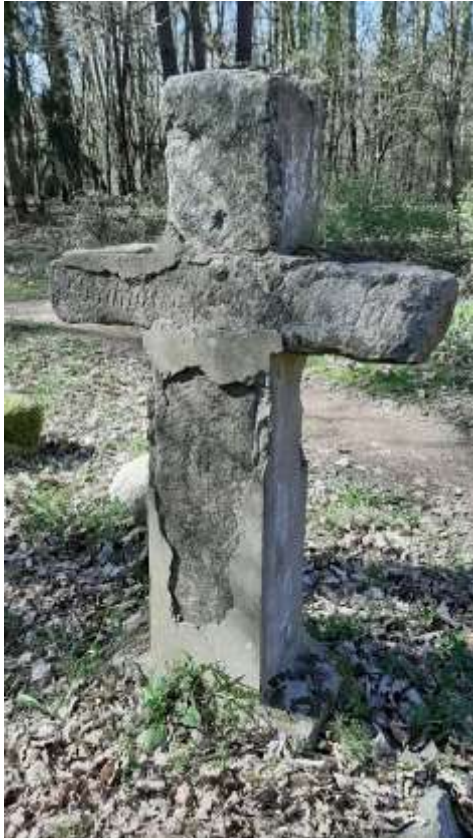
Abbildung 3) Das Butterkreuz zwischen Alt Schwerin und Sparow.