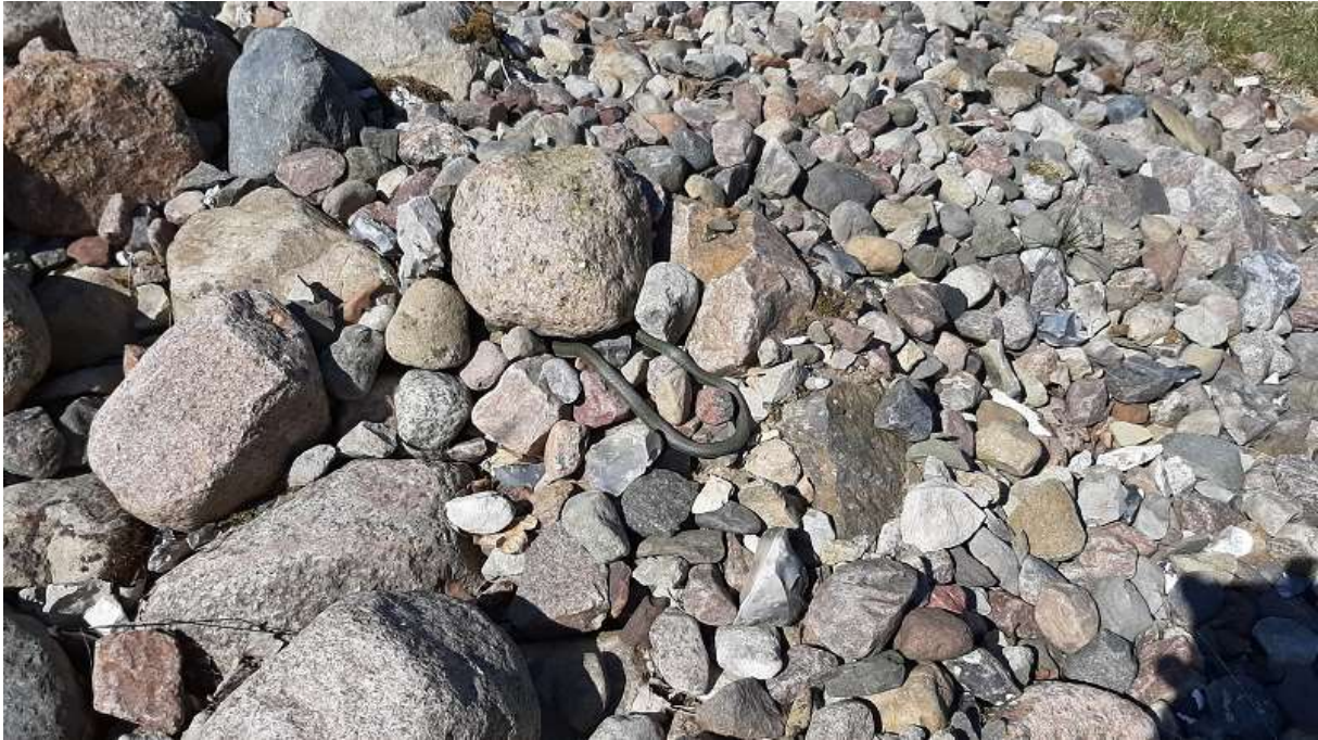
Abbildung 2) Zwei Blindschleichen können wir beobachten.

Der Weg ist asphaltiert. Die Zeiten, wo der Genosse Erich Honecker hier entlanggefahren ist, sind schon dreißig Jahre her. Aufwurzeln trüben den Fahrpaß.