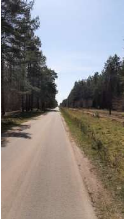
Abbildung 1) Die Straße gehört uns!

Vor dem Ortsende ist ein Weg nach Drewitz ausgeschildert. Der Weg entspricht einem ländlichen Wirtschaftsweg. Damit muss beim Ausweichen und aneinander Vorbeifahren aufgepasst werden. Mitten im Wald wird Wacholder angepflanzt. Wir legen eine kleine Pause beim Holzlagerplatz ein.